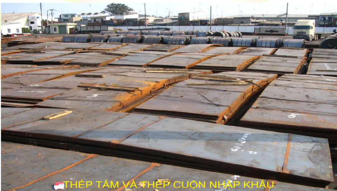
THÉP TẤM VÀ THÉP CUỘN NHẬP KHẨU

- Ngoài ra thép lá dạng cuộn, bằng dây chuyền xả băng hiện đại, cuộn khổ lớn sẽ được xả ra thành các bản nhỏ có các kích thước tùy ý dùng để làm phôi cán ra các loại thép ống, thép xà gồ hoặc phục vụ các nhu cầu cơ khí mang tính tự động cao khác.